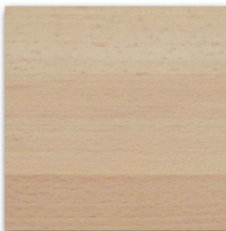
03 - Naturale