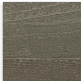
08 - Fumo