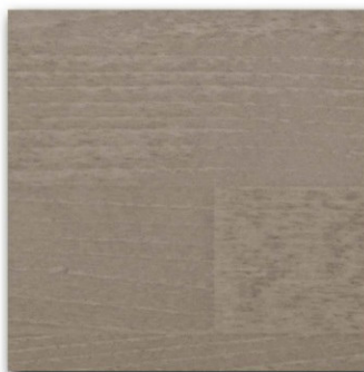
07 - Smoke