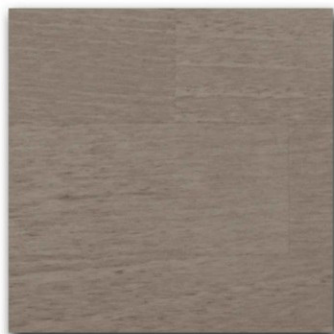
05 - Tabacco