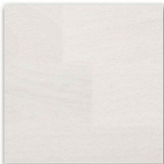
01 - Sbiancato

Faggio lamellare levigato con finitura a tre mani di vernice sintetica nelle tonalità traslucide e coprenti.