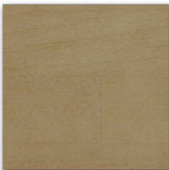
10 - Rovere