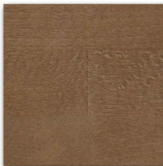
11 - Noce