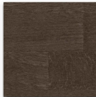
12 - Wengè