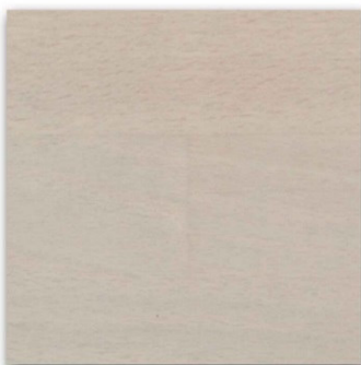
02 - Milk