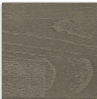
06 - Stone